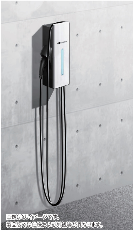
画像はCGイメージです。 製品版では仕様および外観等が異なります。