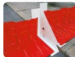
▲段差対応アタッチメント