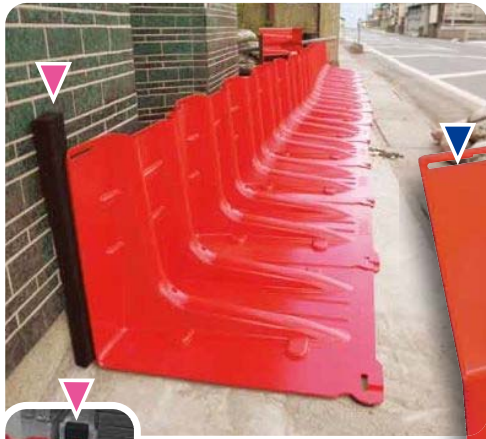
ボックスウォールの背後に壁がある場合はシーリング材を使用