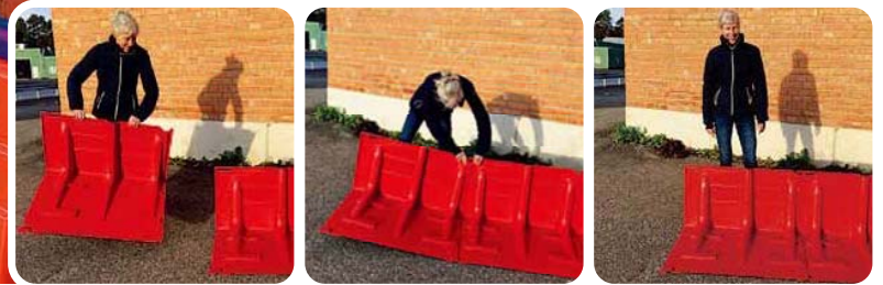
▲設置は、ボックスウォールを背後から見て左から右に並べる

Boxwallは特殊な工具やスキルを必要とせずに設置ができ、ユニットのジョイント部(▼印)をつなぐことができます。各ジョイント部は±3度の調節ができ、カーブした設置場所でも対応可能です。