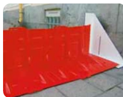
▲サイドアタッチメント