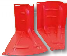
アウトコーナー(左) インコーナー(右)▶